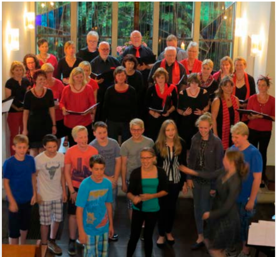
Gemeinsam singen der Gospelchor und die Konfirmanden.