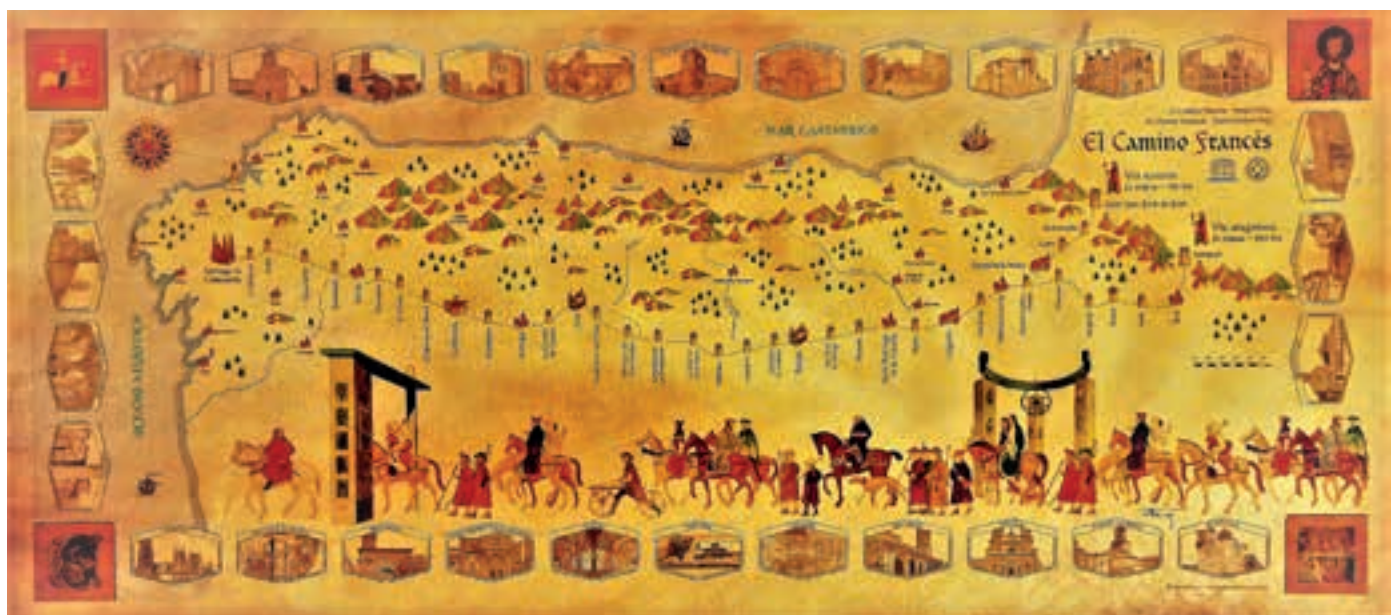
HISTORISCHE DARSTELLUNG DES JAKOBSWEGS